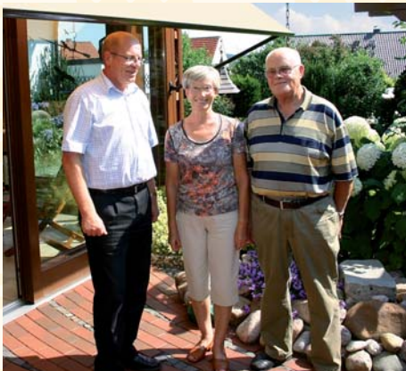
Zufriedene Gesichter bei der Präsentation des neuen Heizsystems