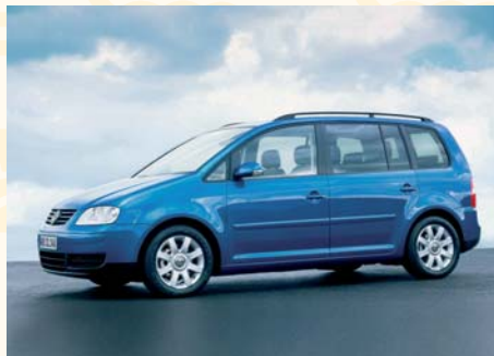
Ein beliebtes Erdgasauto

In diesem Jahr zeigten die Kraftstoffpreise Woche für Woche an der Tankstelle, dass es doch noch höher geht. Immer wieder gab es neue Rekordmarken. Selbst Dieselfahrer stöhnen - ihr Preisvorteil ist wie eine Seifenblase zerplatzt. Sie zahlen so viel wie „Normal“-Fahrer.