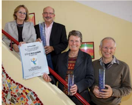
Projekt „trinkWASSER“ in der AWO-Kita in Bünde-Spradon

Andere Getränke, oftmals stark gesüßt, stehen höher im Kurs als reines Wasser. Aber in einer Zeit der zunehmenden