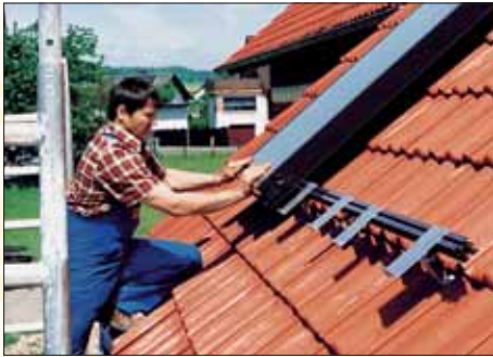
Erdgas und Sonnenenergie - ideale Partner

Nachtspeicheröfen, 10 erdgasbetriebene BHKW, 10 Erdgaswärmepumpen, 50 Erdgas-Haushaltsgeräte, 50 Brennwertgeräte, 50 Heizungspumpen, 20 Erdgasautos. Es gilt das Eingangsdatum des Antrages.