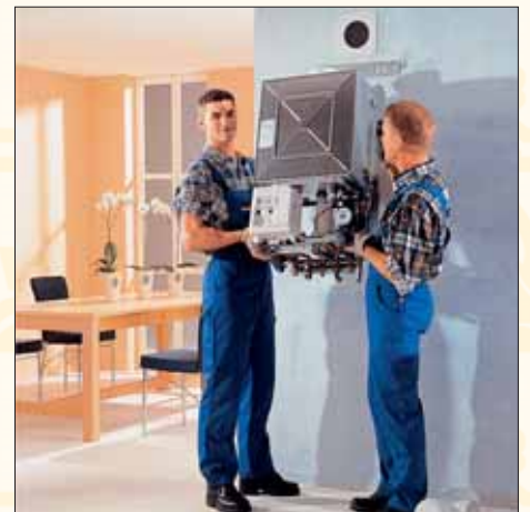
Mit moderner Erdgastechnik Energie sparen