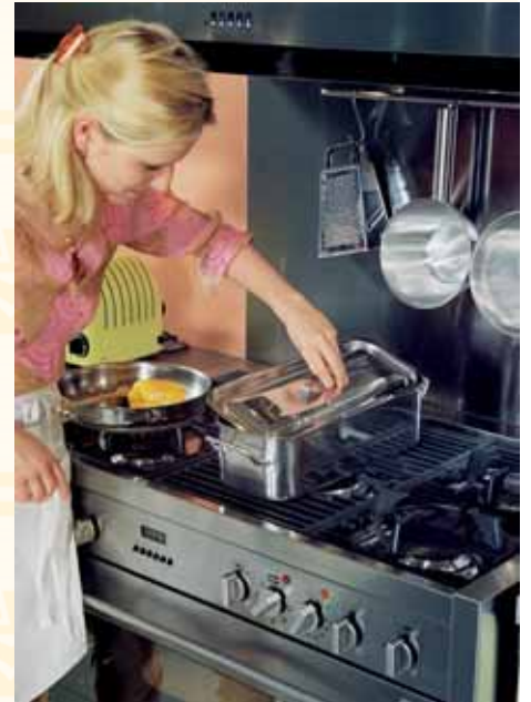
Sparen beim Kochen mit Erdgas

Liebe Leserinnen und Leser, wir sagen herzlichen DANK für die angenehme, vertrauensvolle Zusammenarbeit und wünschen Ihnen ein friedvolles, geruhiges WEIHNACHTSFEST sowie ein gesundes und erfolgreiches Jahr 2007.